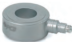
Kraftmessunterlegscheibe mit Ladungsausgang Serie PCB-M21x

*Dieses Modell beinhaltet sowohl metrisches wie auch nicht-metrisches Montagezubehör