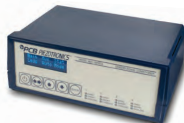
ICP®-Signal-Konditionierer Modell PCB-482C24