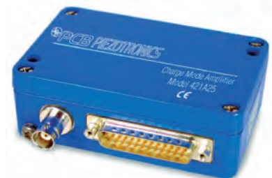
Ladungsverstärker Modell PCB-421A25